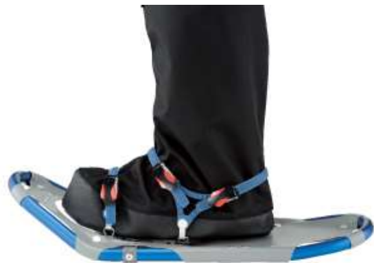
オーバーシューズ装着例 (スノーシュー装着時)